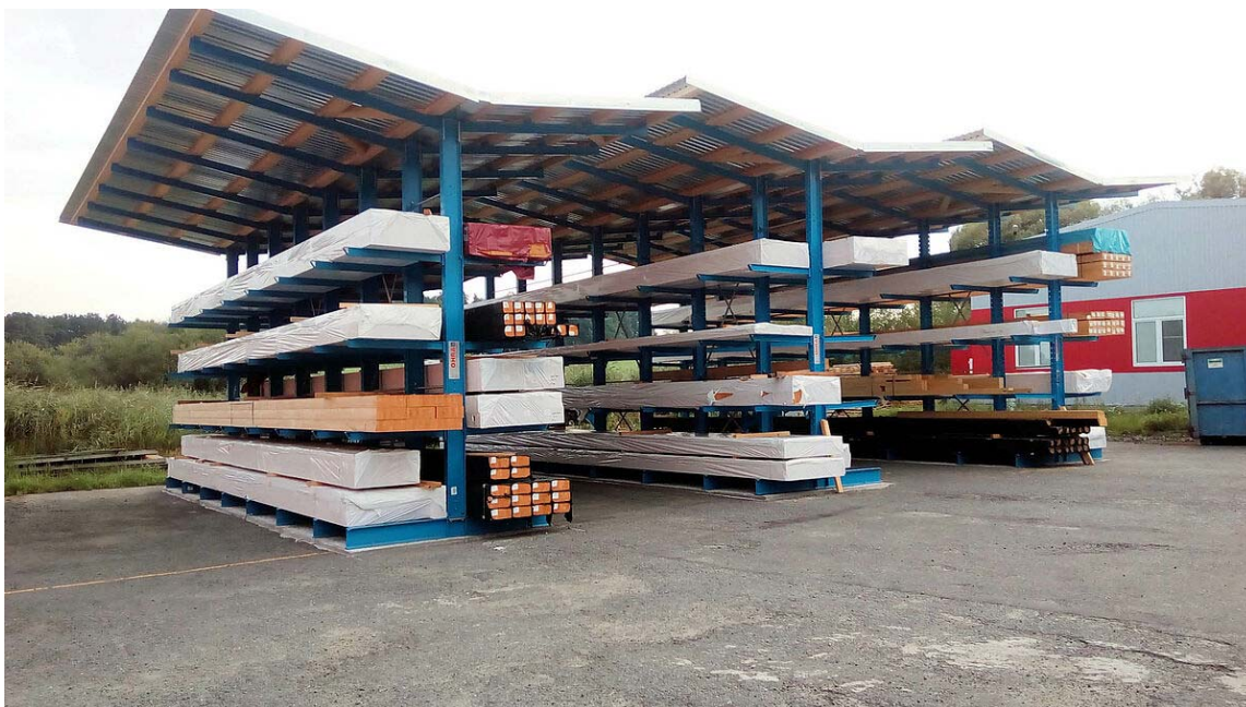
Esempio tipologia dei Cantilever in progetto

Ad oggi l'area destinata ad ampliamento/piazzale si presenta assolutamente pianeggiante, omogenea e priva di discontinuità morfologiche. La stessa, a seguito dei precedenti interventi di consolidamento dei "movimenti franosi", individuabile nella specifica relazione geologica, si presenta estremamente uniforme e dotata di un sottofondo compatto ma permeabile, per lo più composto di inerti di varia pezzatura e solo in parte da terreno naturale. Quest'ultima condizione è da ricondurre alle precedenti lavorazioni di "messa in sicurezza/consolidamento" del versante realizzate mediante asporto dei preesistenti terreni, rimodellamento e messa in opera di uno strato di ghiaia naturale compattata.