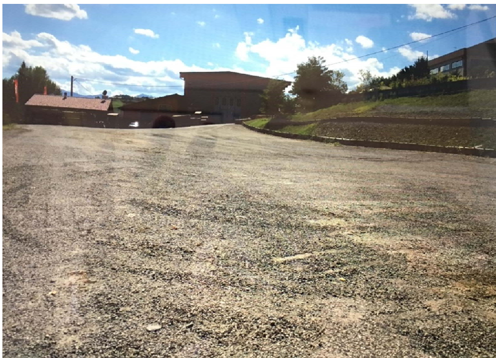
Vista del piazzale direzione est con vista delle opere di consolidamento di monte